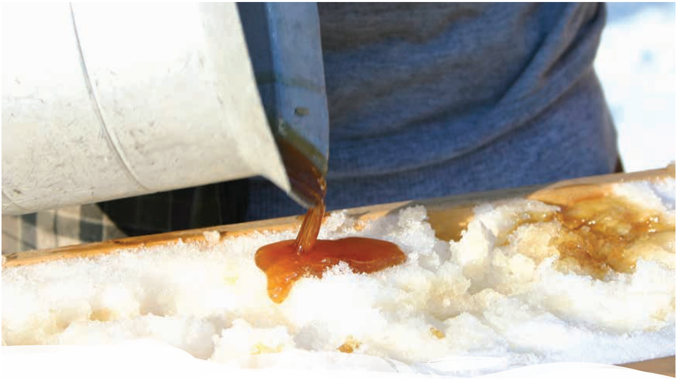
© Crédit : iStockPhoto.com, réf. 97491638, « Barbe à papa d'érable ».

pression sur le gouvernement fédéral pour que soient reconnus les droits distincts et inhérents des peuples autochtones oubliés du Canada. En dépit de leurs années de travail commun, dans les années 1970-1980, les Métis et les Indiens non inscrits ont élaboré des programmes distincts afin de rétablir leur bien-être. Les premiers cherchaient à obtenir le statut d'Indien tandis que les plus derniers continuaient d'élaborer un programme fondé sur leur identité et leur histoire distinctes, estimant que leur objectif d'autodétermination reposait sur leur authenticité et que c'était la seule façon de maintenir leur santé et leur bien-être.