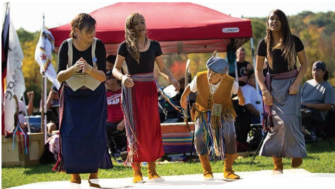
© Crédit : Anna Uliana 2014. Autorisation de reproduction fournie par Jaime Koebel, « Prairie Fire danseurs Métis ».

aux Métis et aux Indiens non-inscrits de créer des programmes de formation pour les enseignants, de développer leurs capacités en tant que travailleurs des tribunaux et qu'intervenants en toxicomanie, de créer des Centres d'amitié avec d'autres Autochtones vivant en milieu urbain et de construire des coopératives d'habitation avec la Société canadienne d'hypothèques et de logement afin d'acheter des maisons et des immeubles pour les louer à leur propre peuple. Tous ces programmes ont été conçus afin d'aider les gens à guérir en reconnectant les familles après des générations de blessures causées par l'angoisse de la colonisation. Parallèlement, ces organisations politiques provinciales se sont unies à l'échelle nationale pour créer le Conseil national des autochtones du Canada (CNAC) afin de faire